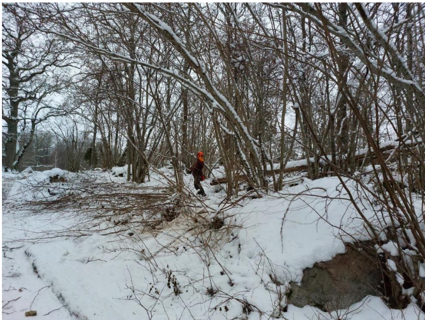
Bild 2. Arbetet pågår. Hassel utglesas manuellt.