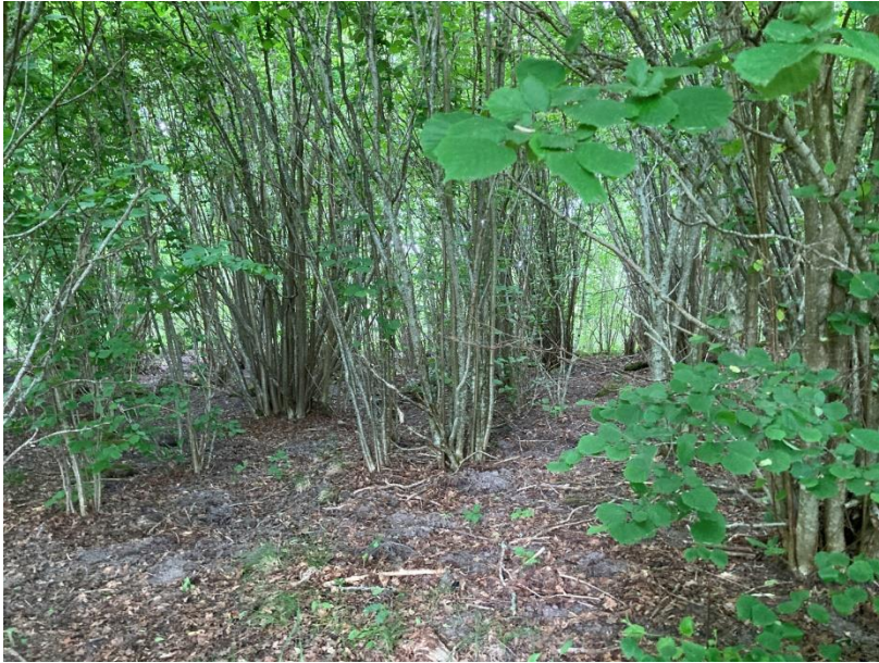
Bild 8. Före åtgärden. Bilden visar igenväxning av ung hassel. (ObjektID 682).