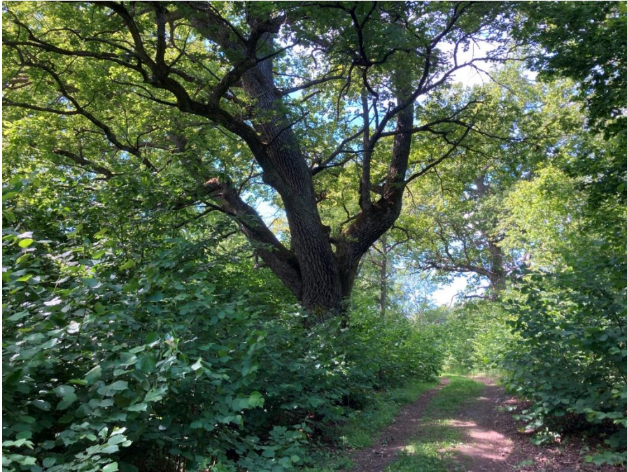
Bild 6. Före åtgärden. Bilden visar igenväxning av ung hassel. Här ska det öppnas upp för eken.