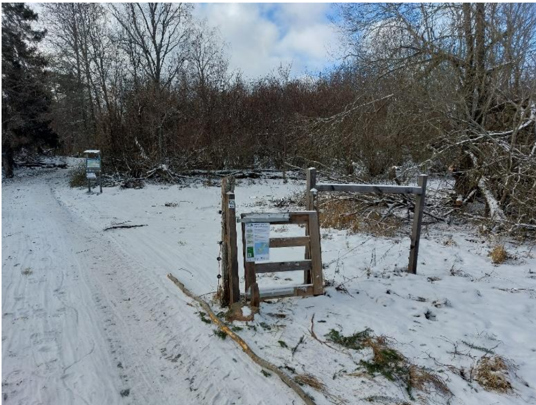
Bild 14. Bilden visar den nya självstängande grinden på andra sidan av vägen. 2024-02-09 ObjektID 884b.