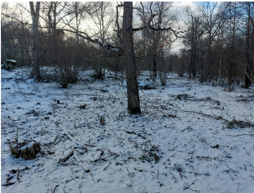
Bild 9. Efter åtgärden. Unga hasslar har avlägsnats och en öppen miljö skapats. 2024-02-09 (ObjektID 682).