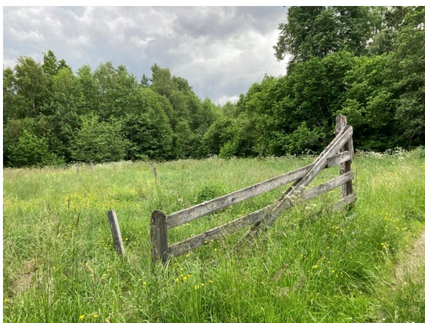
Bild 12. Bilden visar den gamla grinden innan borttagning. 2022-06-15 (ObjektID 684).

Arbetet gjordes under våren 2021. 410 m gammalt stängsel togs bort. Ett antal äldre stolpar lämnades kvar på markägarens begäran.