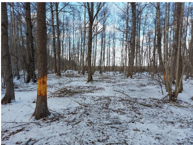
Bild 11. Ett antal träden ringbarkades och blir kvar som högstubbar. 2024-02-09 (ObjektID 39638).