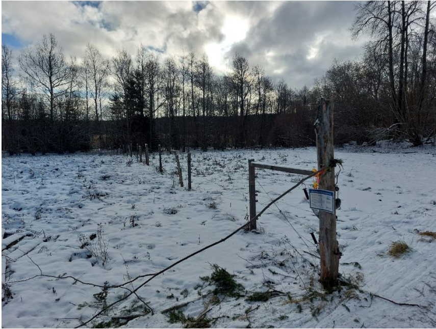
Bild 13. Bilden visar det nya stängslet. Ett antal fina äldre stolpar har lämnats kvar på markägarens begäran. En del lavpåväxt finns redan. Kanske får vi senare se sällsyntare solälskande lavar på dem?