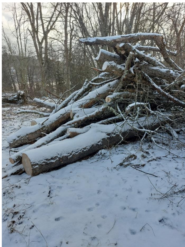
Bild 10. Ett antal faunadepåer har skapats i området. 2024-02-09 (ObjektID 39640).