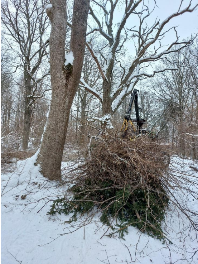
Bild 1. Bilden visar hur utglesat material har samlats i högar med hjälp av traktorn för att senare transporteras bort från området.