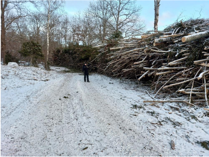
Bild 3. Det utglesade materialet väntar på bortförel från området.