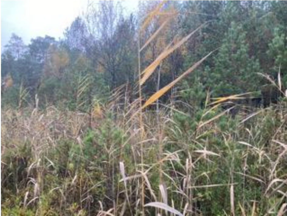
Bild 1. Bilden är tagen före åtgärden. Den visar igenväxning med ung tall som skuggar områdets mer ljuskrävande flora. 2021-09-30 (ObjektID 114).