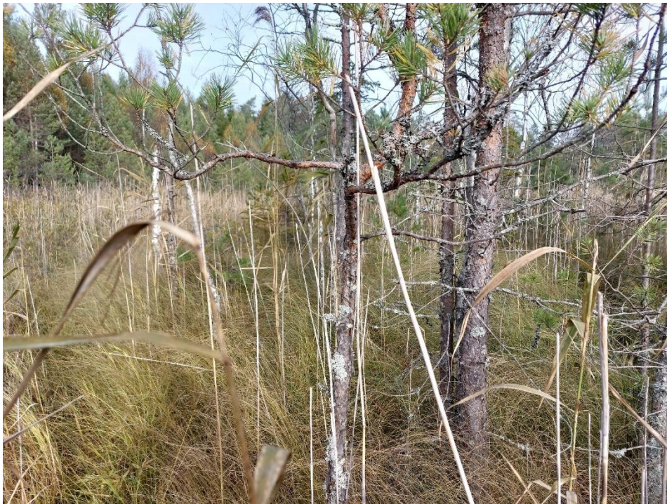
Bild 2. Bilden är tagen före den kompletterande gallringen 2024. En del små tallar återstår att gallra.