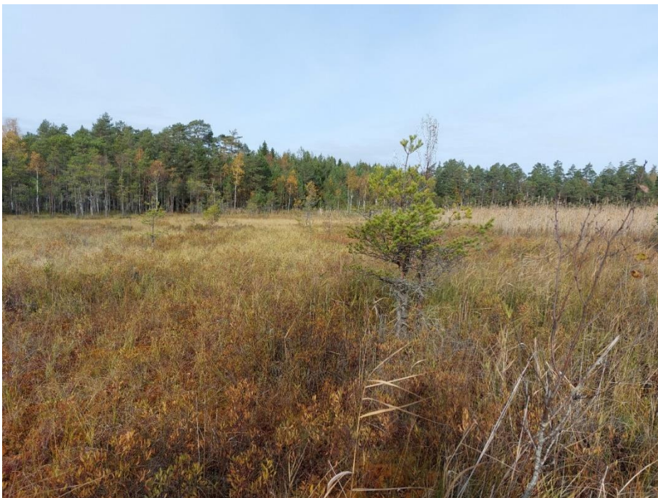
Bild 2. Bilden är tagen efter gallringen. Igenväxning med små tallar har avlägsnats. 2023-10-13 (ObjektID 110).