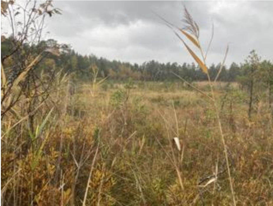
Bild 1. Bilden är tagen före åtgärden. Den visar igenväxning med ung tall som skuggar området mer ljuskrävande flora.