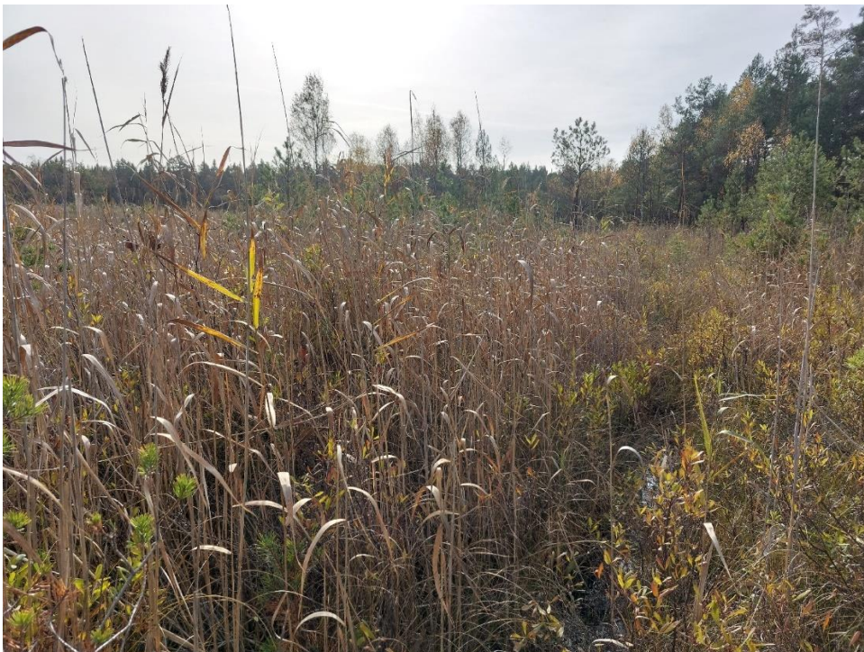
Bild 2. Bilden är tagen efter gallringen. Igenväxning med små tallar har avlägsnats. Slätter av vass återstår. 2023-10-13 (ObjektID 114).