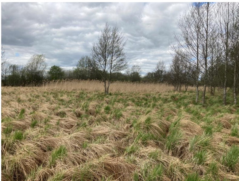
Bild 3. Vass och höga tuvor har vuxit till sig i området som inte betats på länge. Här vill vi restaurera genom tuvfräsning. 2022-05-13 (ObjektID 502).

Åtgärden är planerad att genomföras under 2024.