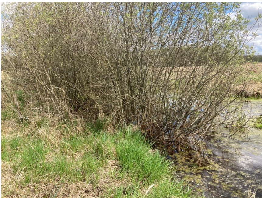
Bild 2. Bilden visar hur Salix -buskarna växer tätt. Dessa ska tas bort.

Åtgärden är planerad att genomföras under 2024.