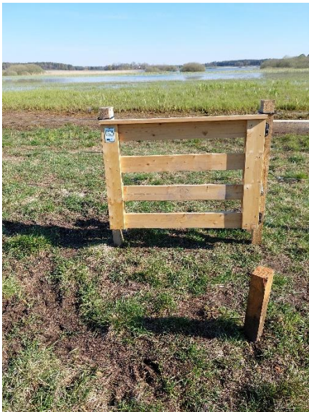
Bild 6. En självstängande grind underlättar passagen för besökare. Området har besöksklassats med målsättning som framtida klass nummer 1-område dvs. med den högsta besöksklassen och det är därför viktigt med tillgänglighet.

Området är klassat som framtida besöksklass 1 (högsta besöksklassen) och därför har originalplaneringen enligt ansökan ändrats (ingen stängselgenomgång hade ansökts om) och fyra självstängande grindar finns nu på plats.