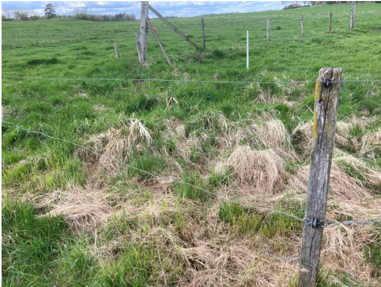
Bild 7. Bilden visar äldre stängsel som ska tas bort. (ObjektID 511).