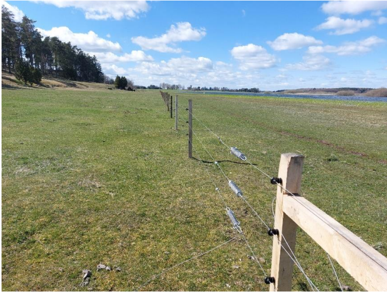
Bild 5. Stängslet längs med stranden. Ny slåttermark om 18.4 ha har skapats.