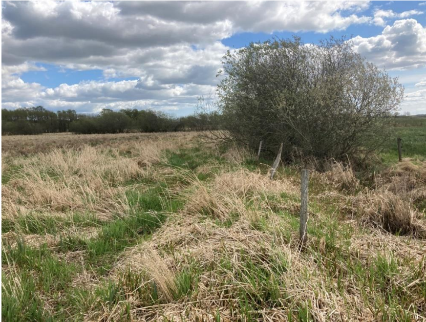
Bild 1. Bilden visar Salix -buskarna längs med diken och i bakgrunden. De både skuggar markvegetationen och försvårar skötsel av stängslen.