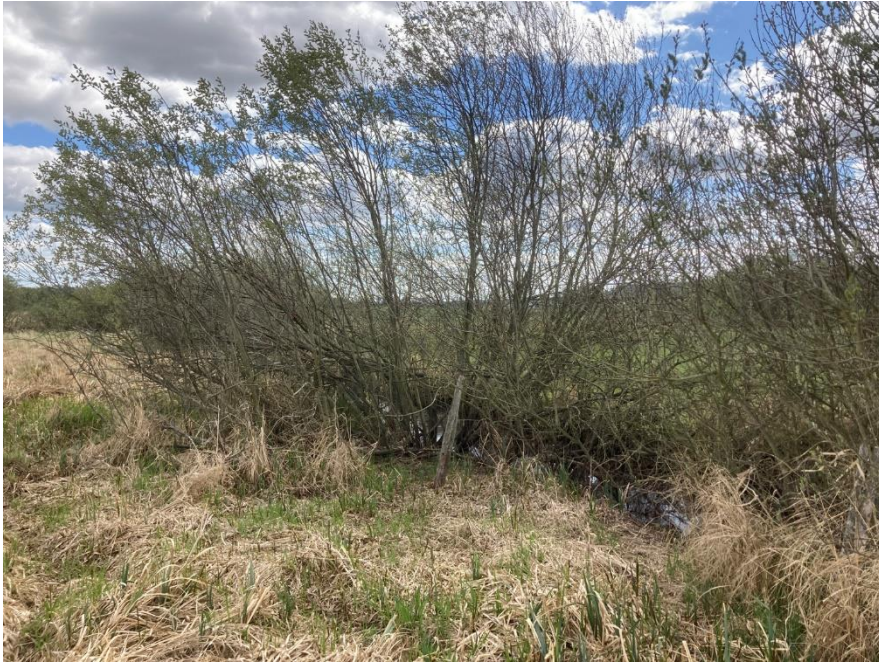
Bild 4. Bilden visar Salix -buskarna som ska stubbfräsas. Buskarna ska dock helst ryckas upp med rötterna om möjligt och i andra hand stubbfräsas. Detta sker för att minimera arbetet med återväxten. 2022-05-13 (ObjektID 494).