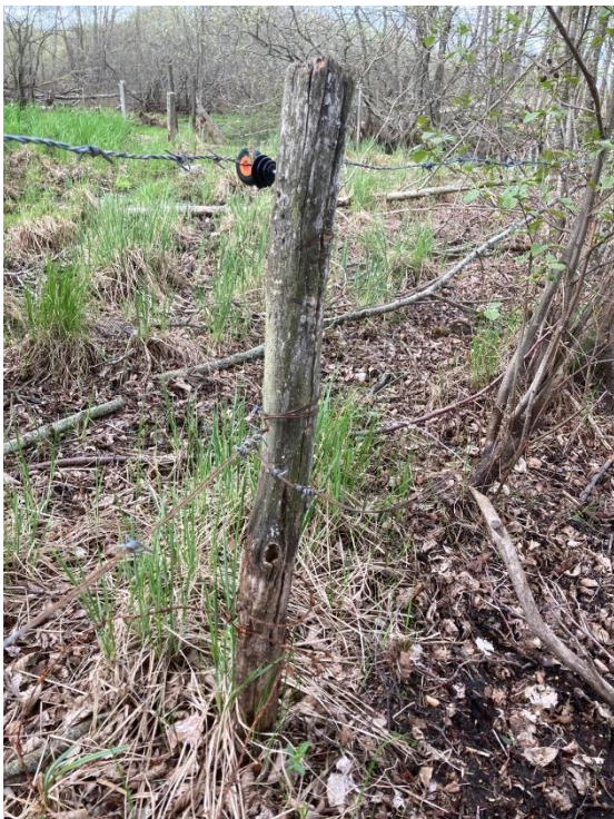
Bild 8. Bilden visar äldre stängsel. (ObjektID 515).