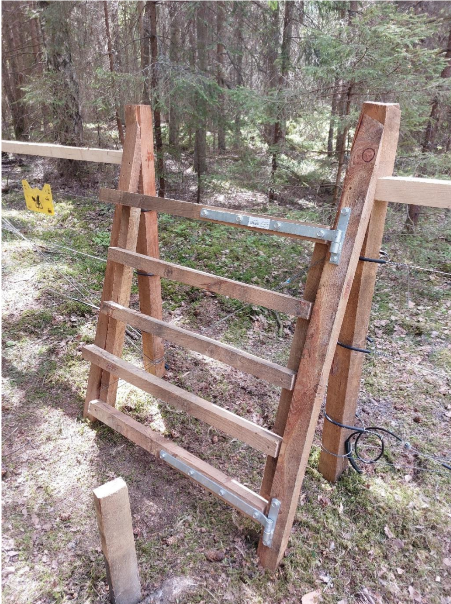
Bild 6. Bilden visar en ny självstängande grind. LIFE-bricka saknas fortfarande men ska fästas snart. (ObjektID 16037).