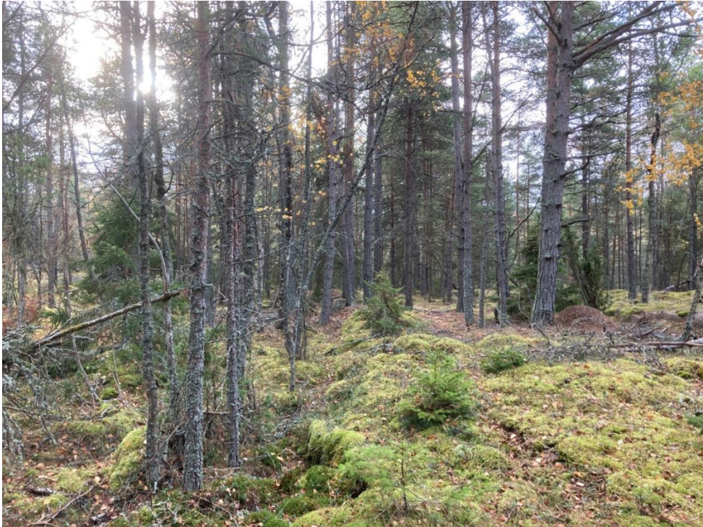
Bild 3. Bilden visar skogen före utglesningen. Här öppnar vi upp och tar bort en del skuggande små tallar. 2021-10-25 (ObjektID 152).