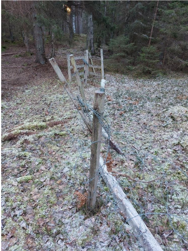
Bild 5. Gammalt stängsel med taggtråd. (ObjektID 2830).

Ett äldre stängsel om 929 m var av dålig kvalitet och försätt med taggtråd har tagits bort under våren 2023.