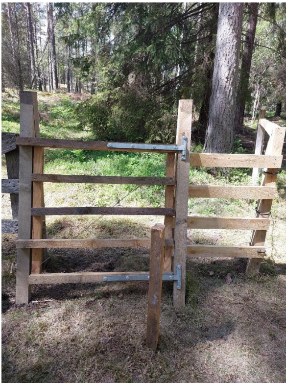
Bild 4. Bilden visar en ny självstängande grind och en parallelogram som en del av stängslet. LIFE-bricka saknas fortfarande men ska fästas snart. 2023-06-02 (ObjektID 16036).

Ett elstängsel med 3 trådar har byggts under våren 2023 för att möjliggöra fortsatt bete i området. Dragningen är 750 m och är kortare än i ansökan p.g.a. att det redan existerade ett välfungerade stängsel i en del av området. Röjning av stängselgata har ingått i uppdraget.