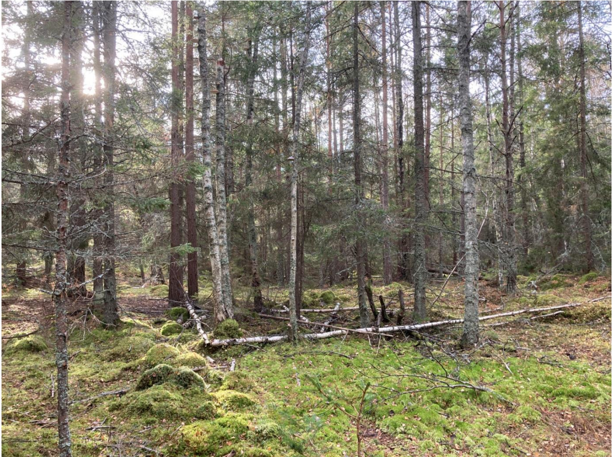
Bild 1. Bilden visar skogen före utglesningen. Unga granar tar plats och här öppnar vi upp för att få lite mer ljus i markskiktet för att gynna mer ljuskrävande flora. 2021-10-25 (ObjektID 156).