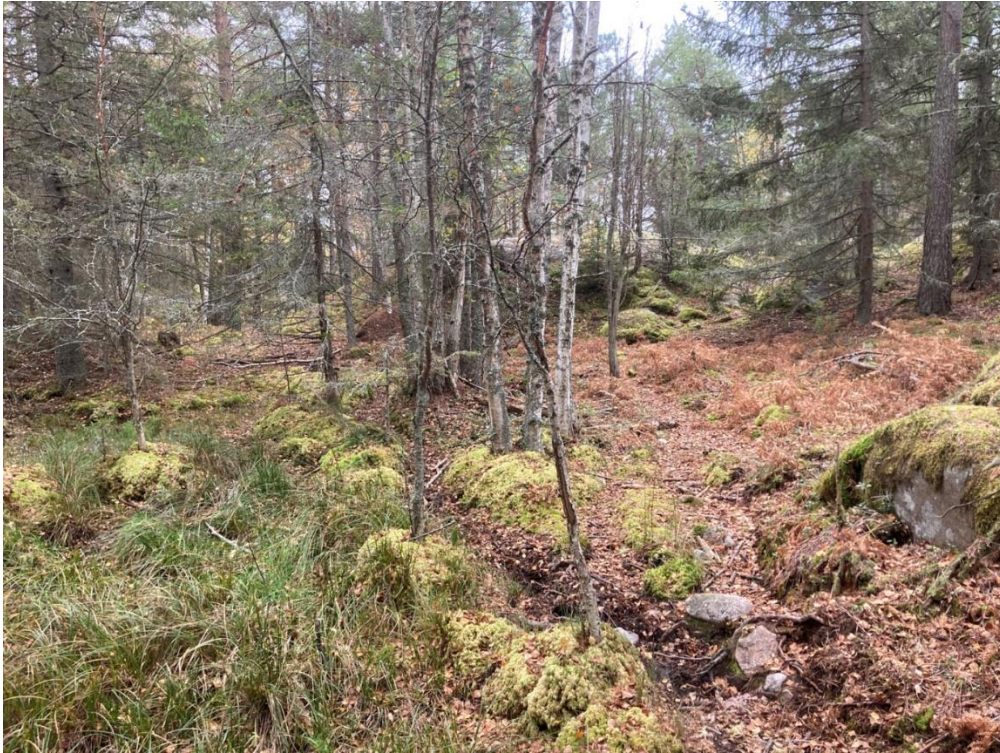
Bild 2. Bilden visar området innan utglesningen. Här öppnar vi upp en glänta och tar bort skuggande granar.