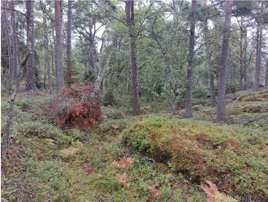
Bild 2. Bilden visar området efter utglesningen. En öppnare miljö har skapats och mer solälskade flora kommer att kunna växa här. Även fjärilar och bin har chansen att trivas i soliga blommande gläntor och bryn som skapas.