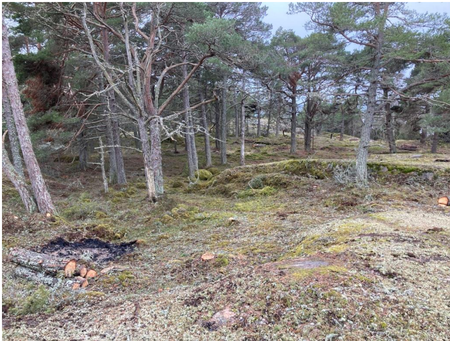
Bild 10. Faunadepåer har lämnats i området. Här kan insekter och svampar trivas i framtiden. 2022-02-24 (ObjektID 303).