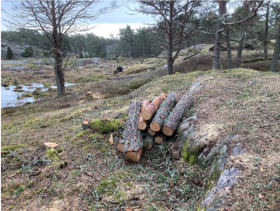
Bild 11. En dödvedshög i det soliga läget gynnar solälskande organismer.