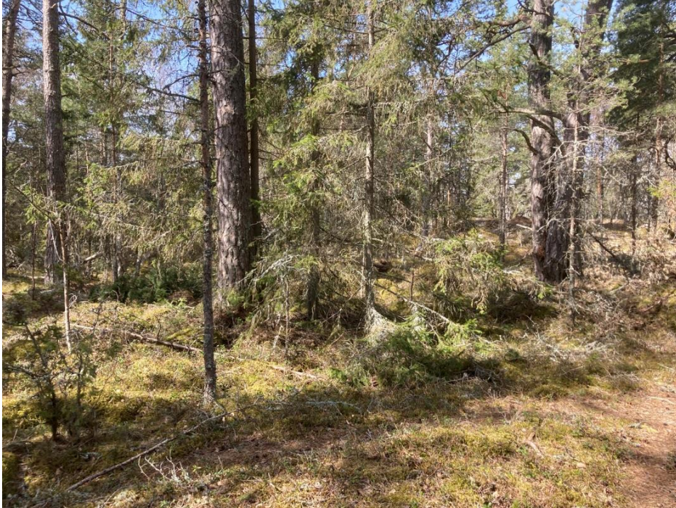
Bild 3. Igenväxning med unga granar. Vi öppnar upp för de äldre tallarna.