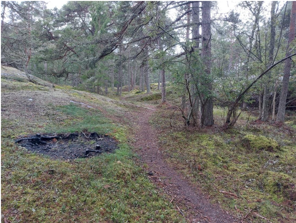
Bild 7. Igenväxning med unga tallar har tagits bort i området. 2023-08-28 (ObjektID 436b).