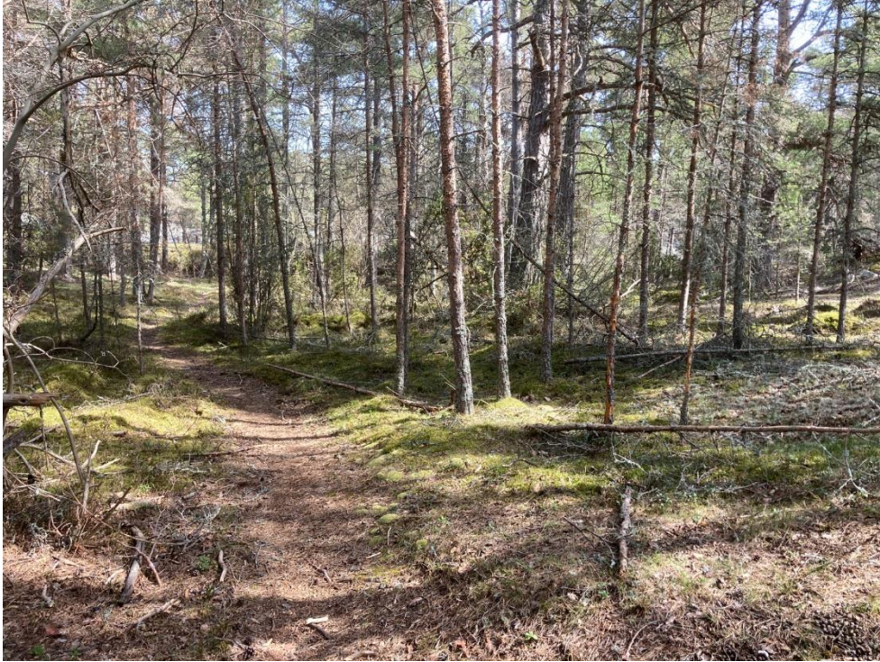
Bild 6. Igenväxning med unga tallar. Vi öppnar upp här och skapar en glänta. 2022-04-29 (ObjektID 436).