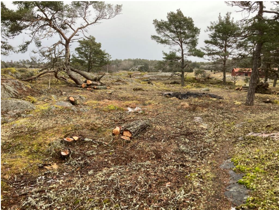
Bild 9. Bilden visar den utglesade skogen närmast gården. (ObjektID 296).