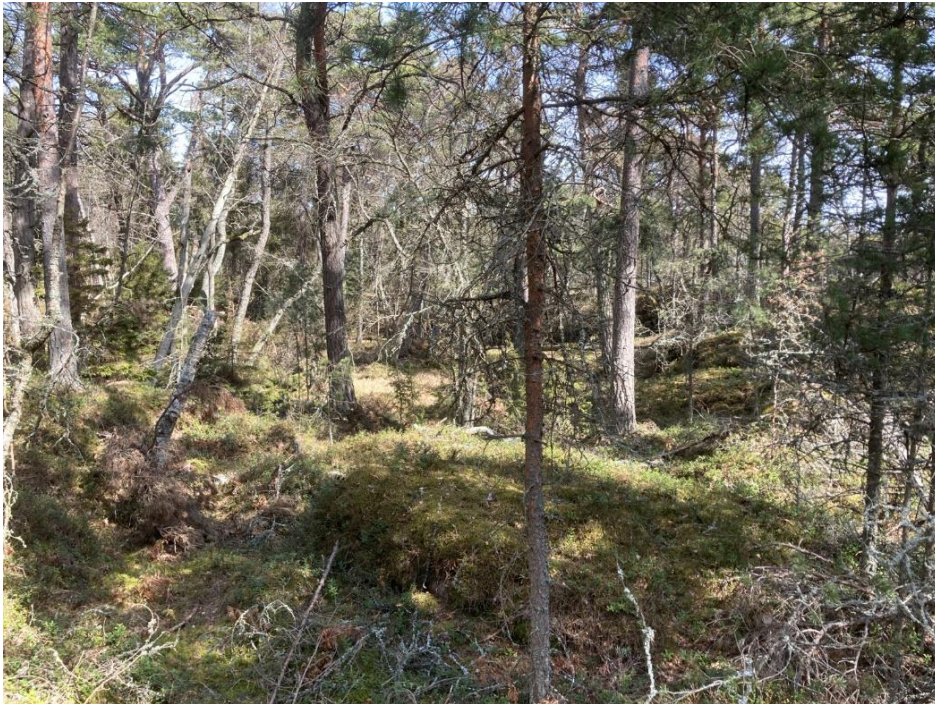
Bild 1. Före utglesning tar unga tallar plats och här öppnar vi upp. 2022-04-29 (ObjektID 429).