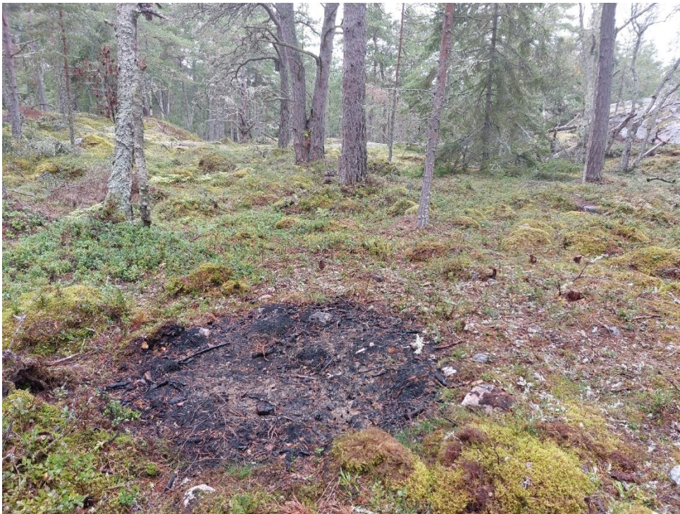
Bild 4. Igenväxning med unga granar har tagits bort i området. Jämför den förgrenade tallen i föregående bild. En punktbränningsyta har skapats. Vi gynnar även brandkrävande organismer. (ObjektID 21236).