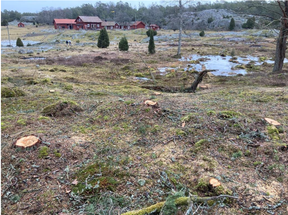
Bild 8. Igenväxning med unga tallar har tagits bort i skogsranden närmast gården. 2023-08-28 (ObjektID saknas).