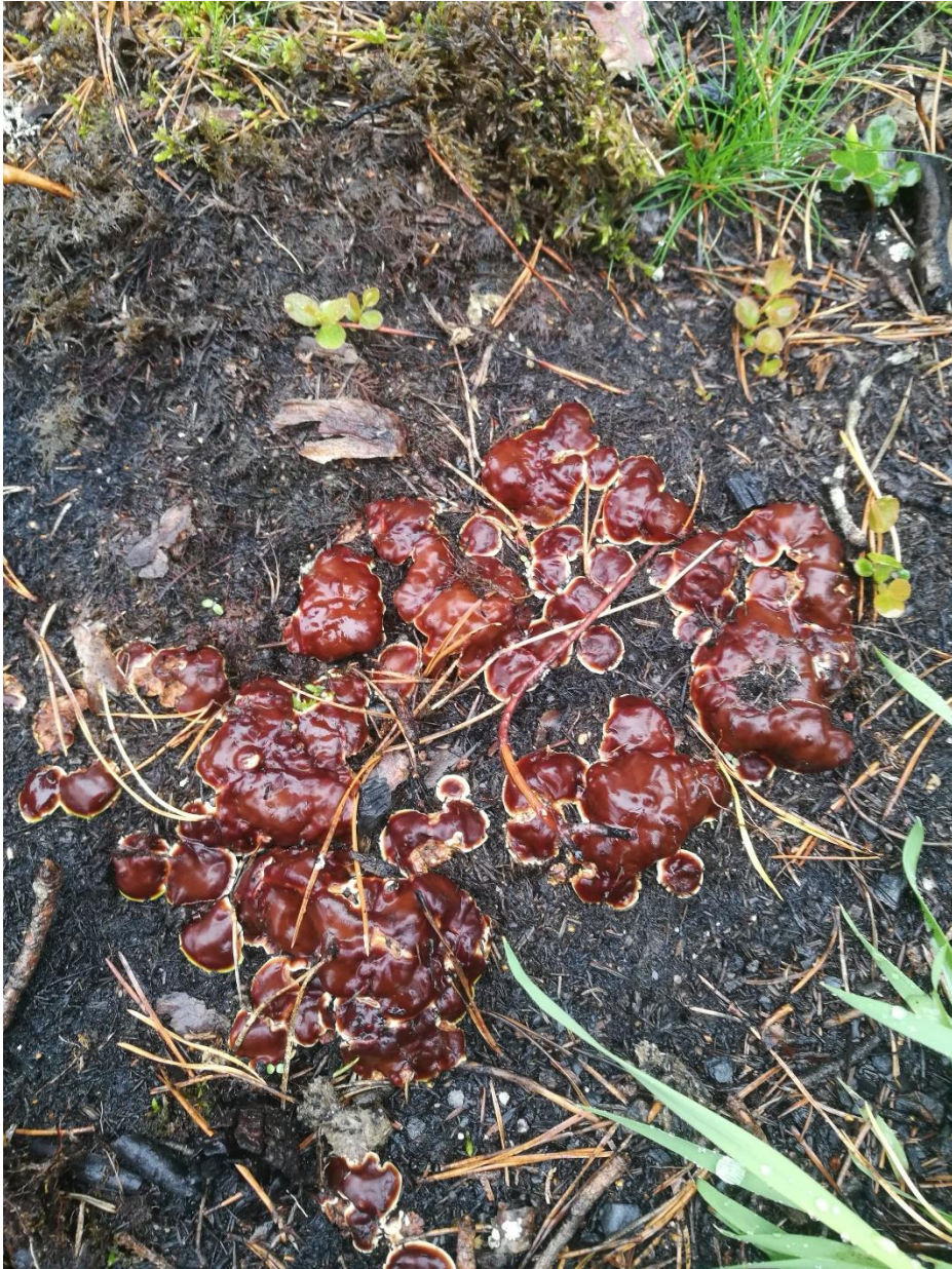
Bild 5. En rotmurkla Rhizina undulata växer redan på bränningsytan. En vanlig art i nyligen bränd skog.