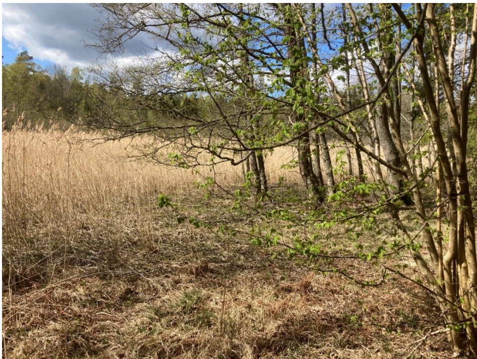
Bild 3. Bilden visar igenväxningsvegetation av alar och vass. 2022-05-12 (ObjektID 479).