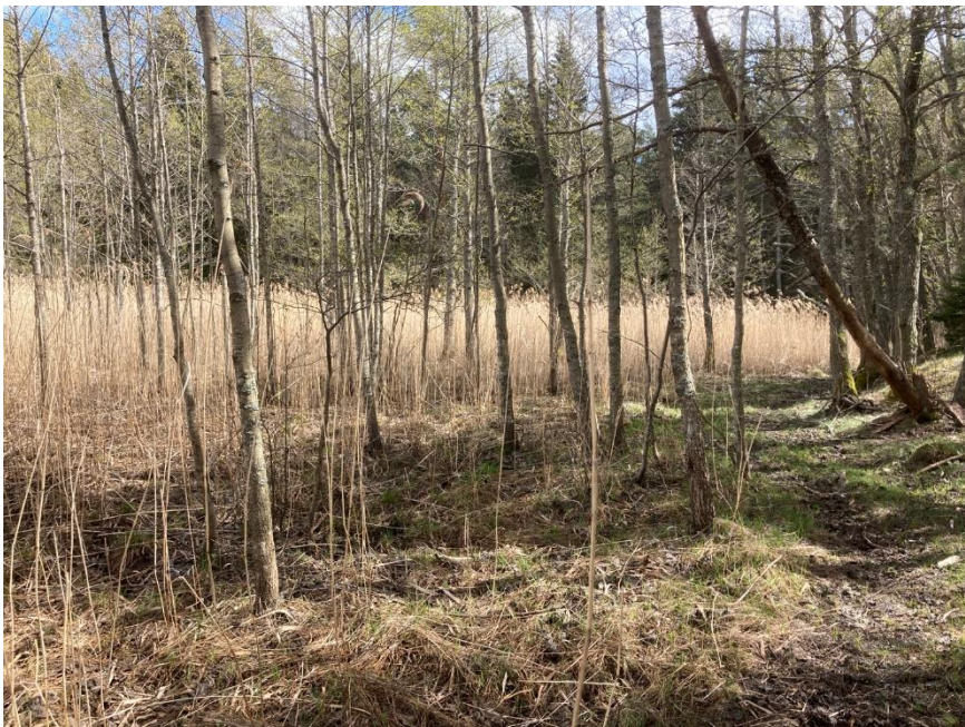
Bild 1. Visar en igenväxningsvegetation av både av unga alar och tätt vass som vuxit till sig vid strandängen. Här vill vi öppna upp för både för den mer ljuskrävande strandängsfloran och fåglarna.