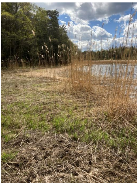
Bild 5. Vassen växer tät vid stranden. Här kommer vi ha slåtter och ta bort den täta vassen som just nu på våren har pressats nere och börjar spira igen.