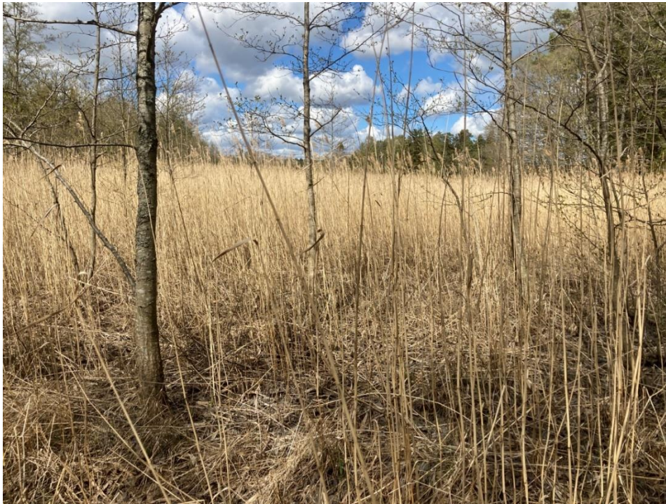
Bild 2. Bilden visar hur unga alar har börjat ta sig in i strandängen och skuggar mer ljuskrävande flora.