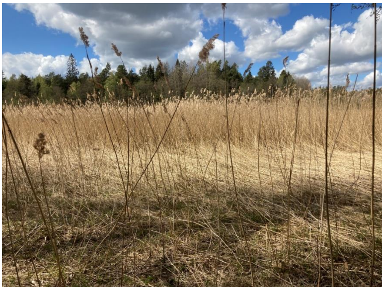
Bild 4. Här växer vassen tät och skuggar strandängsvegetationen. (ObjektID 481).