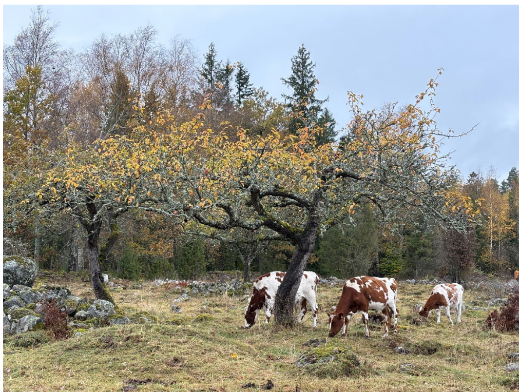
Restaureringsbete genomförs.