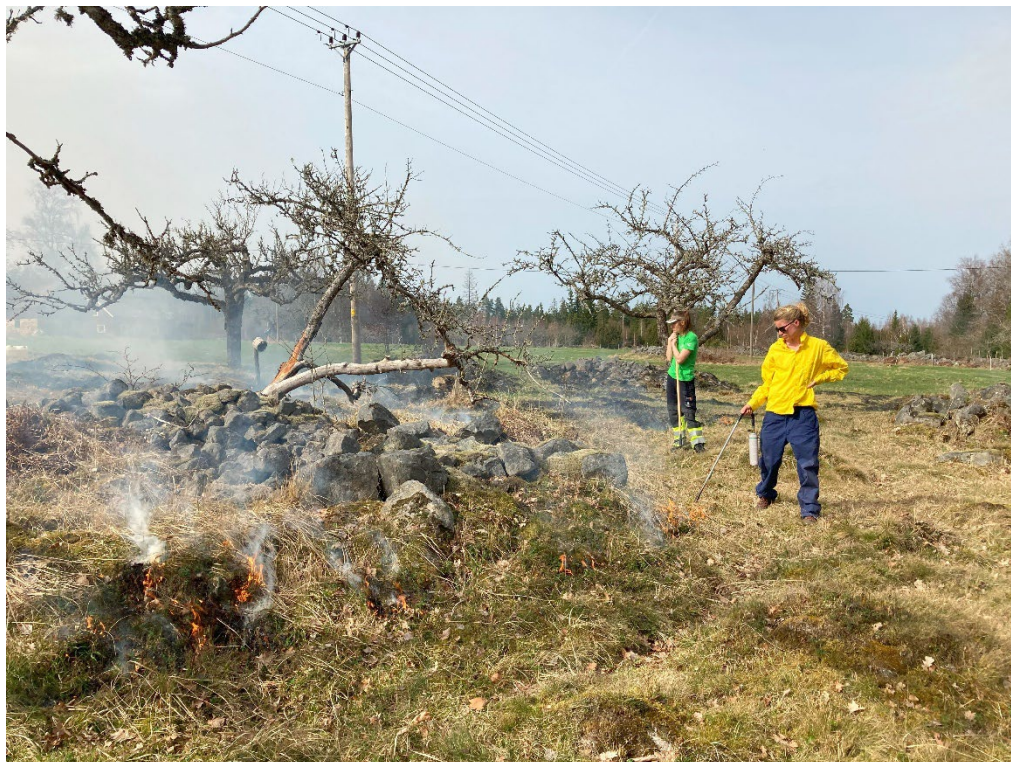
Gräsbränningen påbörjas. Att restaurera gräsmark med bränning är ett bra sätt att få bort mossor och gammal förna som i sin tur gynnar blomrikedomen.