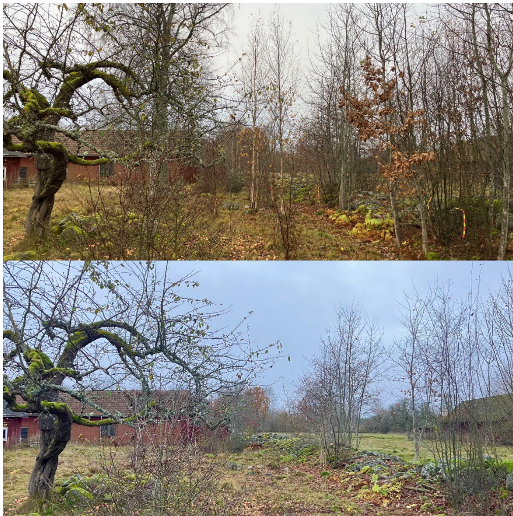
Utglesning av blommande bryn och friställning av blommande små buskar har genomförts. Det gynnar vila pollinatörer i området.