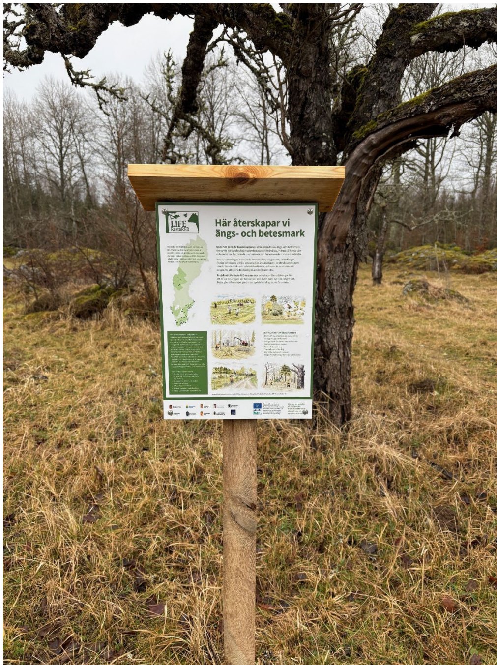
En skylt som informerar om projektet har satts upp centralt i området.