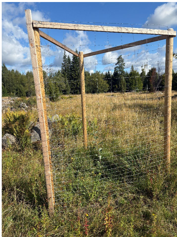
Nya äppelträd har planterats och burats in för att stå emot bete.