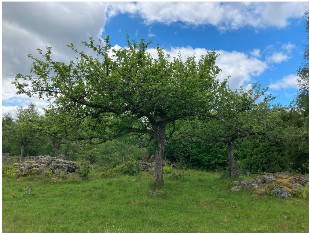
Vildväxande gamla äppelträd av lokala sorter innan beskärning.