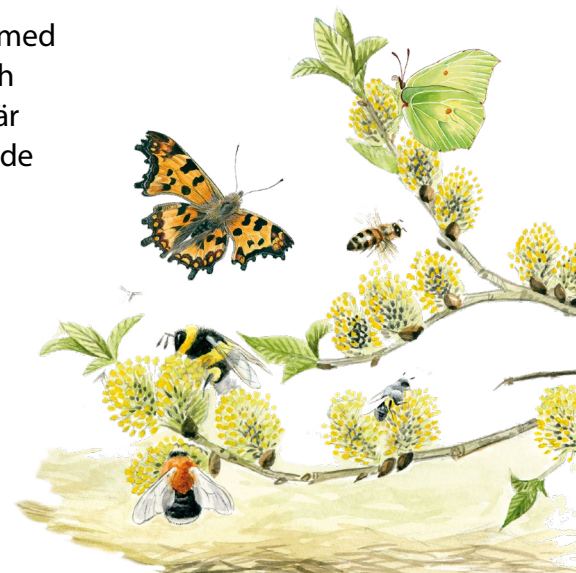
Illustration: Jonas Lundin AB

Häverö Prästäng är ett naturreservat med ängs- och betesmark, ädellövskog och kulturmiljö. Artrikedomen i området är stor, särskilt på de sedan länge hävdade ängarna. Nu ska cirka 9 hektar skog i reservatet restaureras till hagmarker, lövängar och skogsbeten för att återskapa värdefulla livsmiljöer för flera av de arter som lever i vårt svenska kulturlandskap.