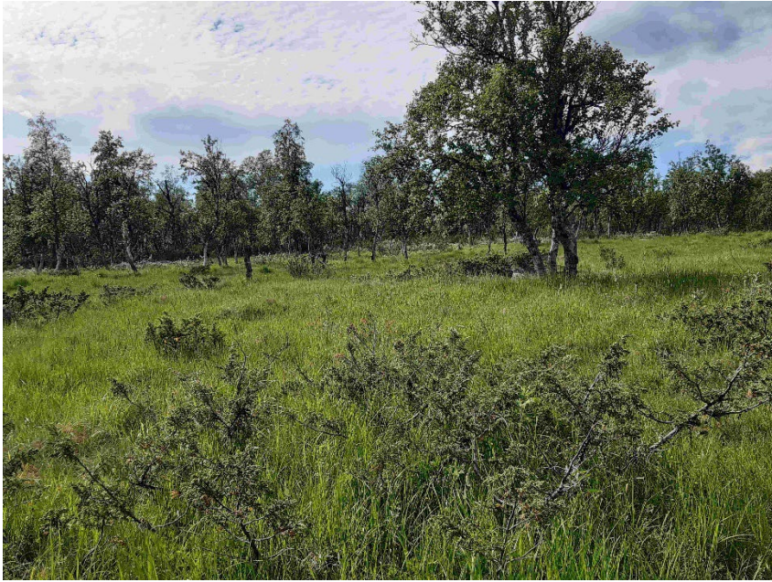
Fotopunkt 1 före åtgärd.