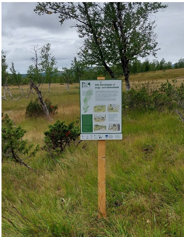
Projektskylt som sattes upp i augusti 2023.

Tre projektskyltar har satts upp i området.