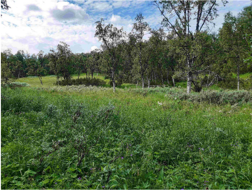
Fotopunkt 7 före åtgärd.