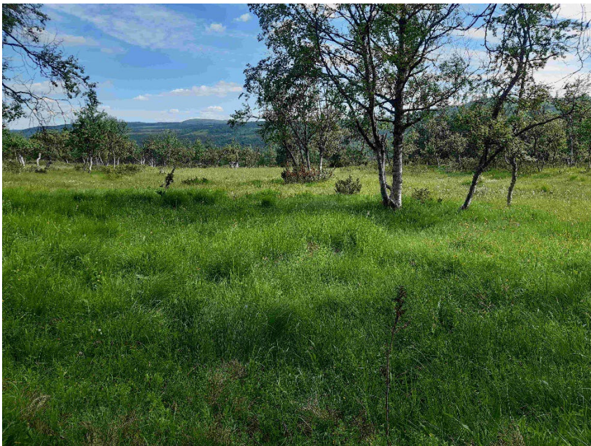
Fotopunkt 2 före åtgärd.