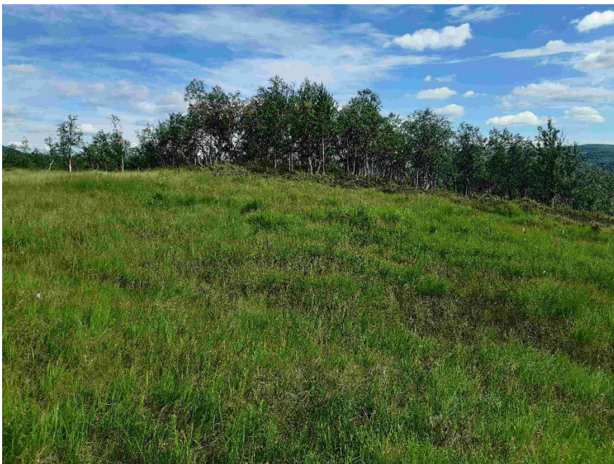
Fotopunkt 4 före åtgärd.