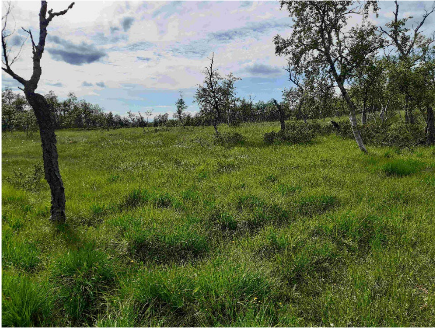
Fotopunkt 5 före åtgärd.