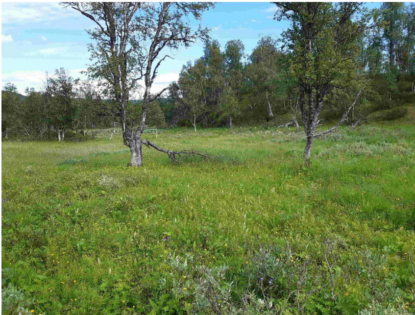
Fotopunkt 6 före åtgärd.