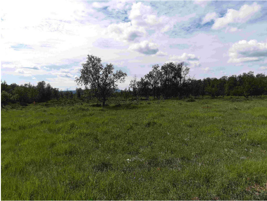
Fotopunkt 3 före åtgärd.