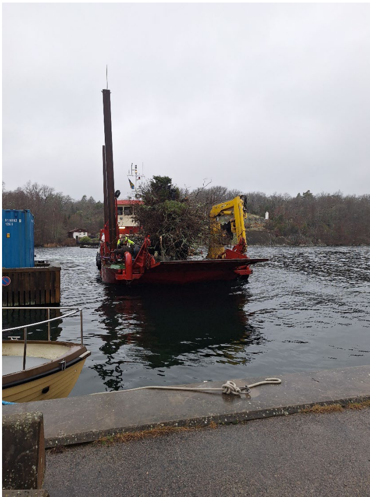
En pråm har använts för att köra iland ris och virke till Järnavik, som är närmaste hamn.

Under januari och februari 2025 har en större åtgärd genomförts på Kalven. Med motorsåg och skördare har medelåldriga ekar fällts för att glesa ur och ge plats. Gamla odlingslyckor har öppnats upp så att besökaren enklare kan uppleva det ålderdomliga landskapet. Död ved har lämnats i faunadepåer och förberedelser har gjorts för att skapa en ekoxekompost.