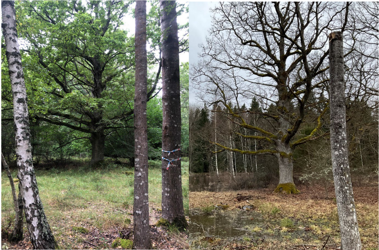
Ek före röjning