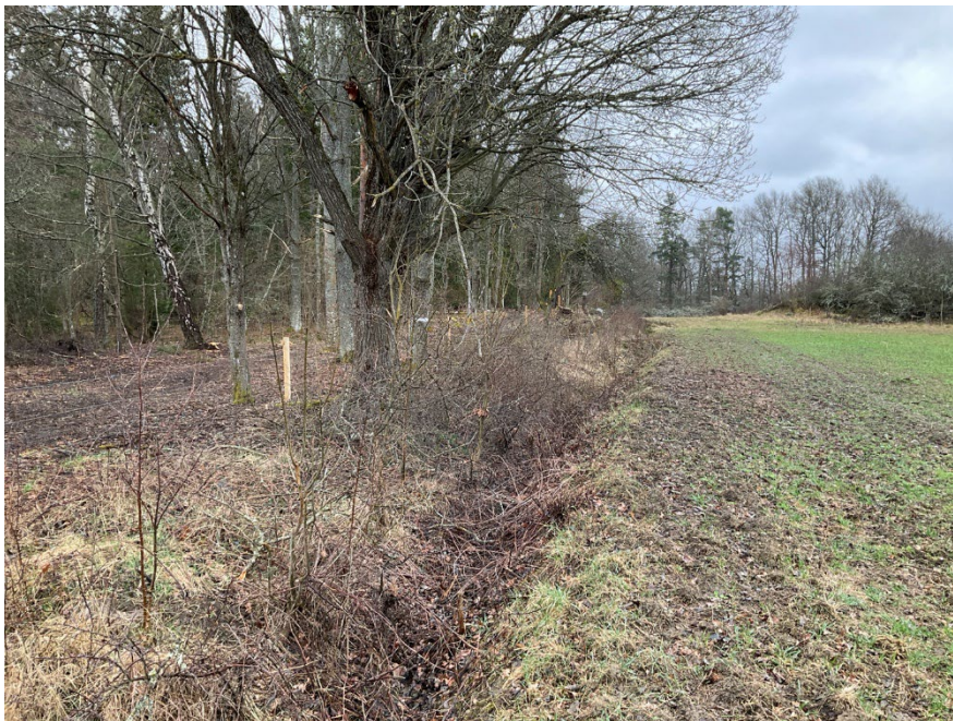
Efter att ett pollinatörsvänligt bryn röjts fram i samband med att nytt stängsel sattes upp. Blommande träd och buskar har sparats såsom slån, nypon och sälg.