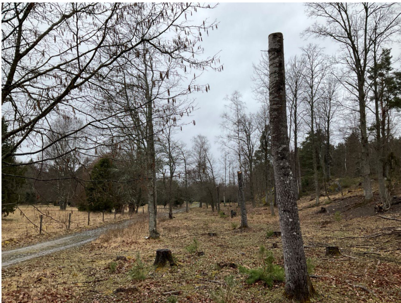
Aspar som blivit högstubbar