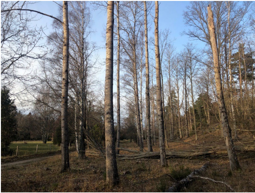
Aspar där vissa ska bli högstubbar