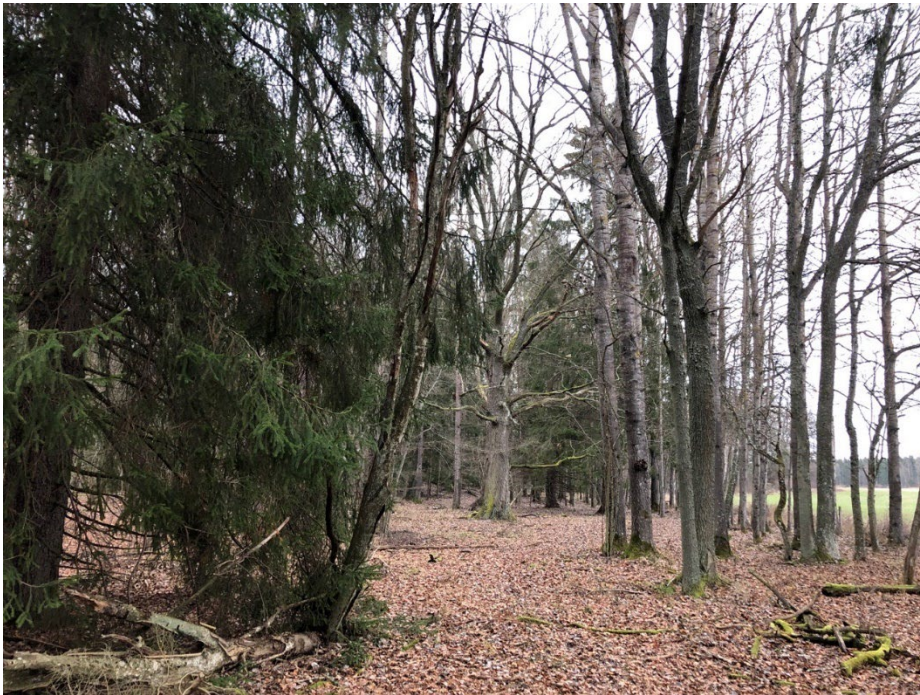
Före röjning av gran, asp och annan igenväxning