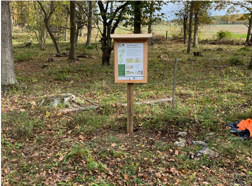
Skylt vid parkeringen (fotopunkt 5)