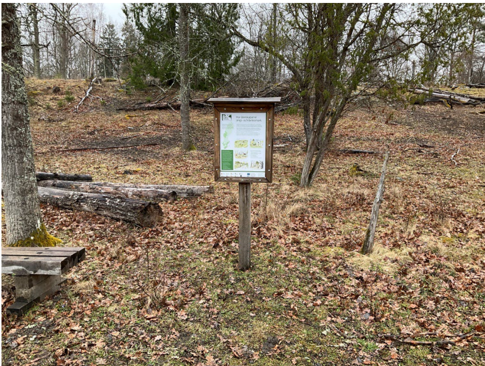
Skylt i anslutning till åtgärderna (fotopunkt 6)