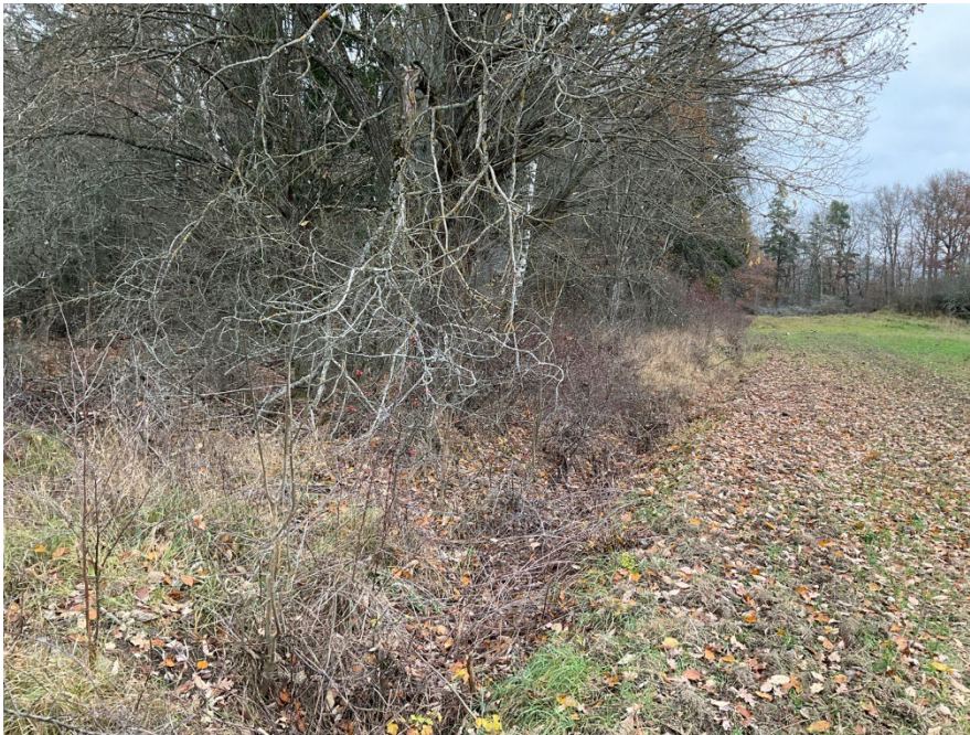
Före röjning och stängsling