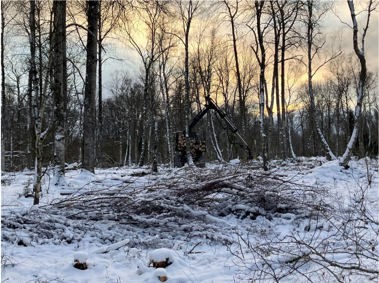
Restaurering pågår under vintern 2023. Här lastas aspar och granar som tagits ner för att öppna upp betesmarken. Hasselsly ligger och väntar på sin tur.