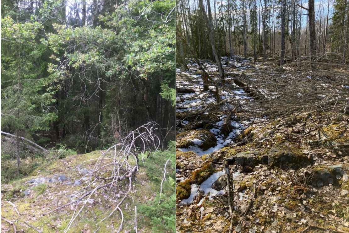
Fotopunkt 2 i karta