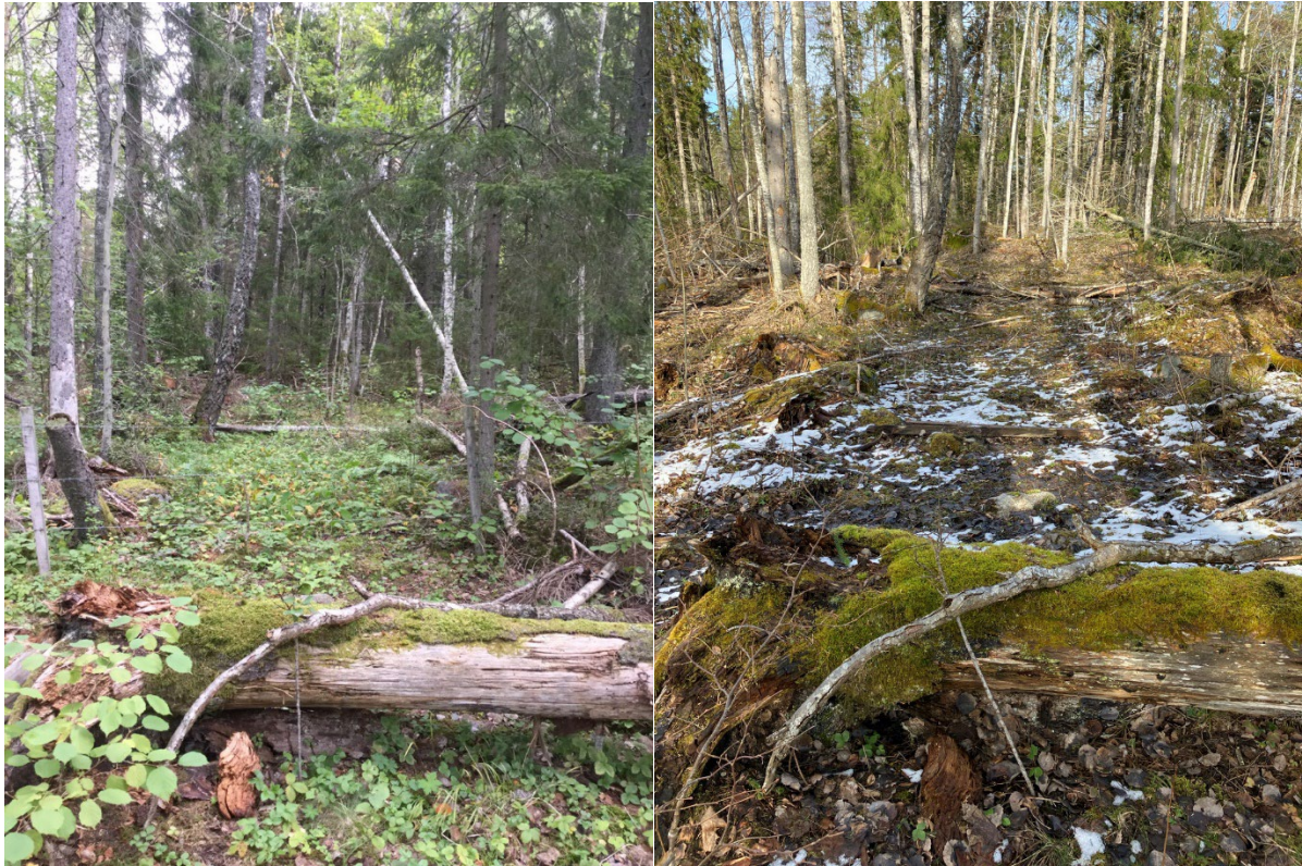
Fotopunkt 3 i karta. Delar av område som ska bli skogsbete.