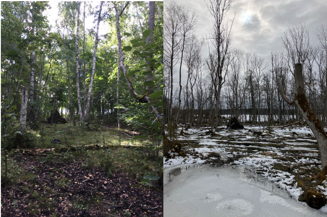
Fotopunkt 5 i karta