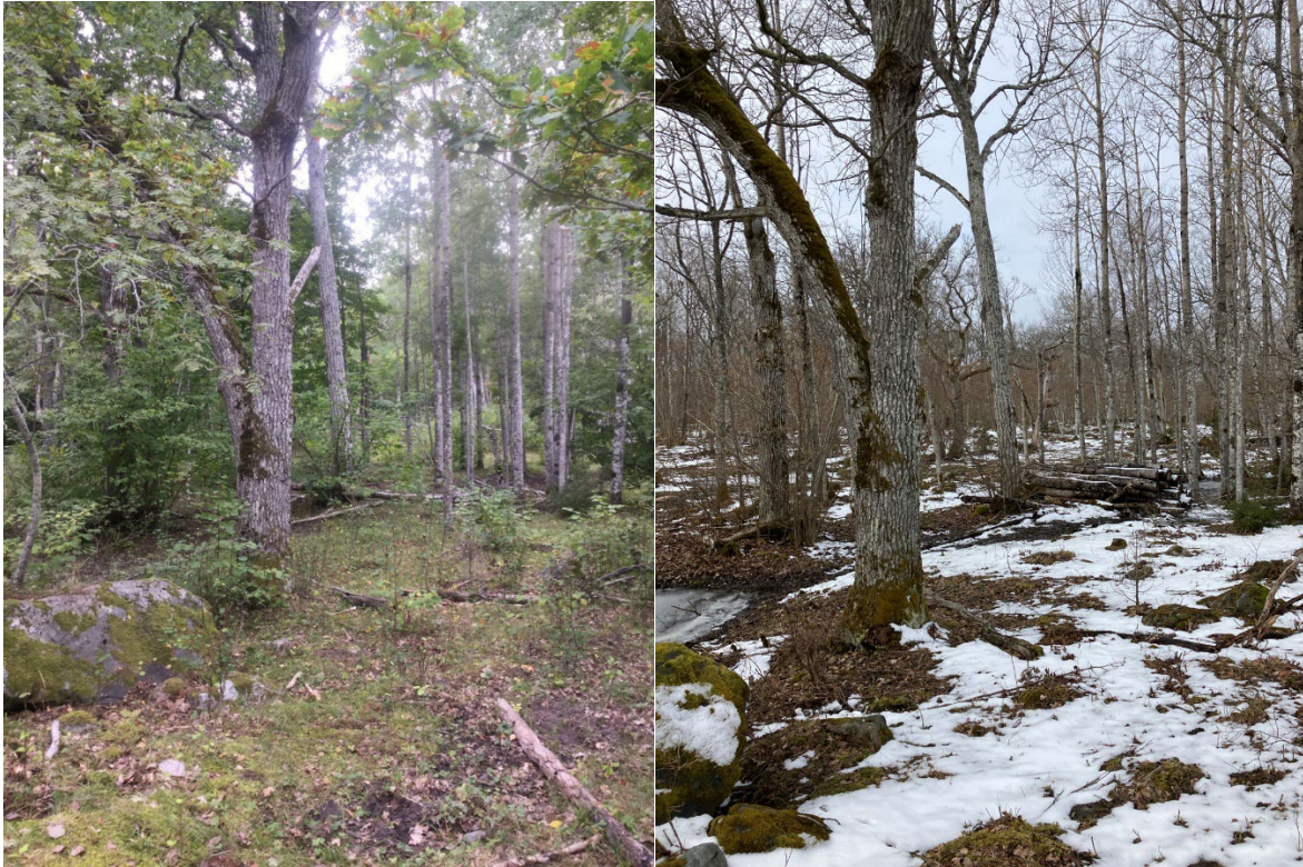
Fotopunkt 4 i karta. Faunadepåer/död ved depå i restaureringsområdet för löväng. Mer asp kommer avverkas vid fortsatta restaureringar.