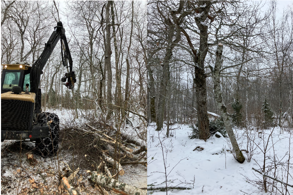
Nyhamling av unga askar och lönnar med skördaragregat i samband med averkning.