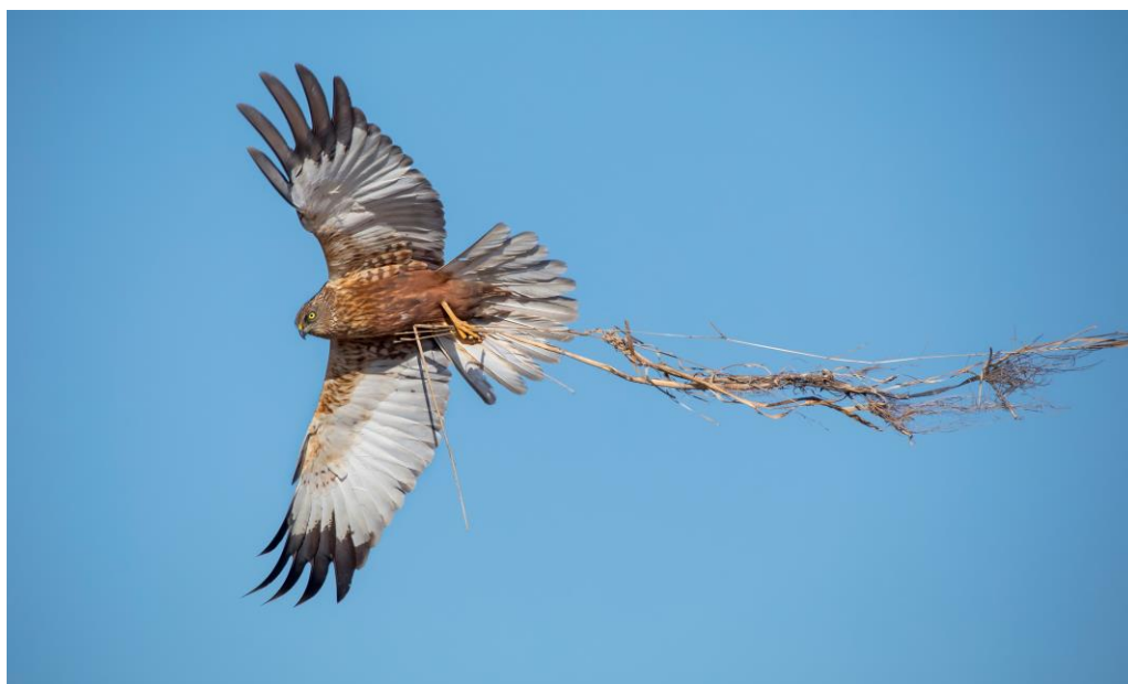
Brun kärrhök med bomaterial.