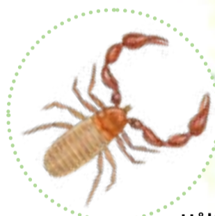
Hålträdklokrypare Anthrenochernes stellae