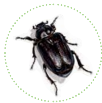
Läderbagge Osmoderma eremita naturlig storlek

Tillfällig lösning. En mulmholk kan liknas vid en överdimensionerad fågelholk. Inne i holken finns material i form av ekspån och löv, som med tiden bryts ner till mulm på samma sätt som sker i ett gammalt träd. Holkarna är ett komplement som kan erbjuda hotade arter ett hem i väntan på nästa generation av hålträd. Samtidigt är det viktigt att värna de gamla träd som finns kvar eftersom de erbjuder många fler livsmiljöer. Det behövs också yngre "ersättningsträd" som kan åldras i ett öppet landskap och med tiden utveckla håligheter.