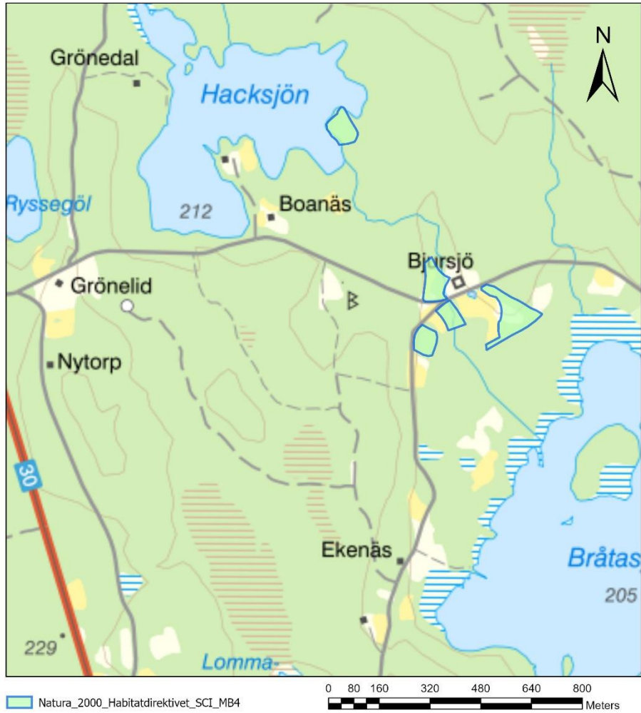
Bild 1 Översiktskarta, N2000-området Bjursjö Overview for the site SE320170