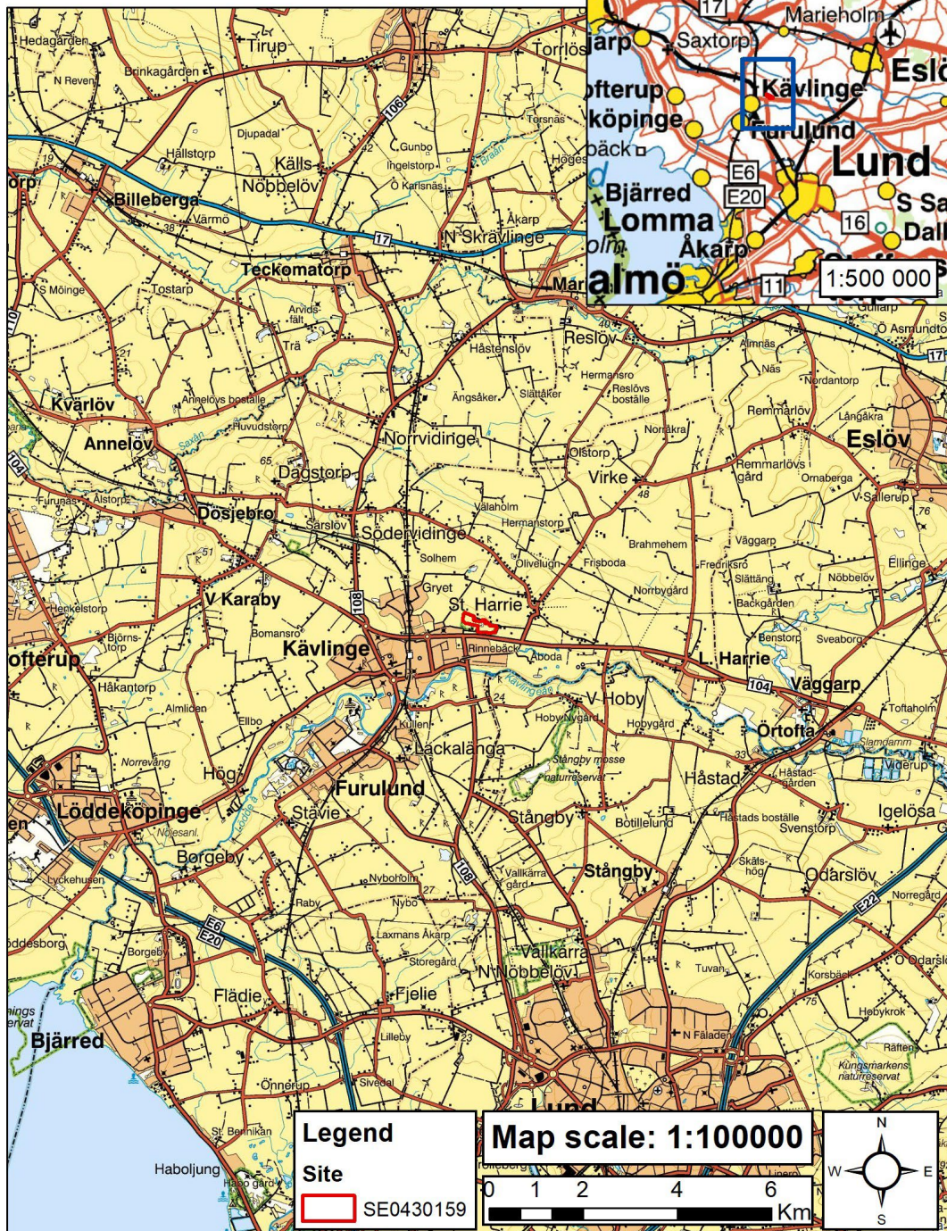
Bild 2 Detaljkarta, åtgärder som genomförs i projektet är syns Detailed map for measures in the project.