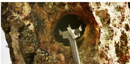
Hackspethål som skapats med hjälp av borr.