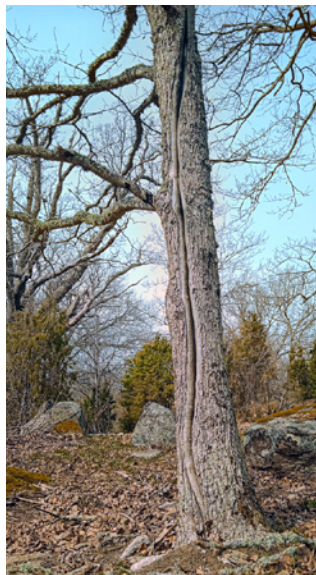
Blixtskada skapad med motorsåg.

De skapade håligheter blir bostäder för arterna att nyttja i väntan på att håligheter och andra strukturer utvecklats naturligt i andra träd. Ofta veteraniserar man sådana träd som vid en ordinarie naturvårdsåtgärd hade gallrats bort. Genom veteranisering skapar man istället mervärden i form av att nya miljöer skapas i träden.