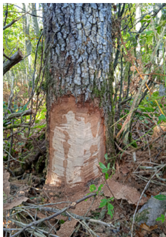
”Hästgnag” skapat med motorsåg.