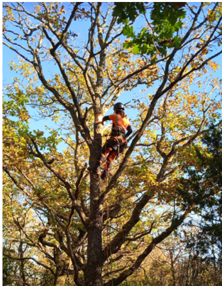
Arborist ringbarkar en topp.